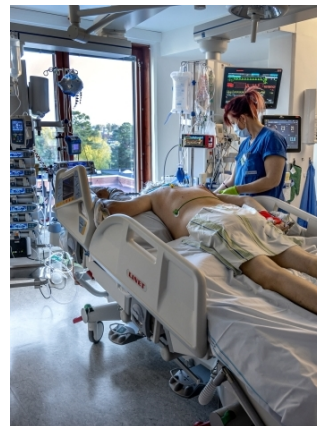
IVA:s vårdplatser i Linde blir tillfälligt stabiliseringsplatser under sommaren 2026.